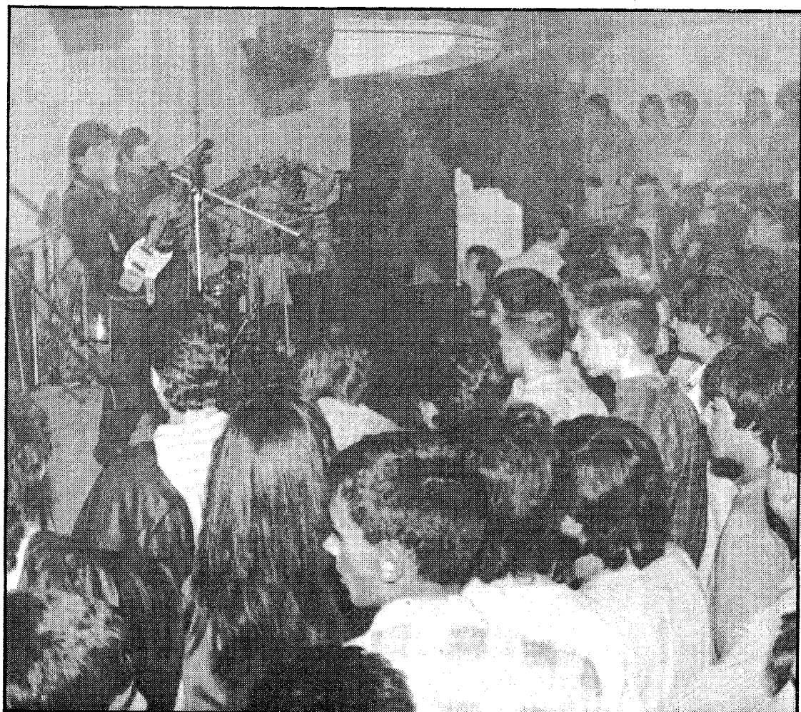
La sala Metro volverá a albergar el concurso «Medio Kilo de Rock», que financia la Diputación General de Aragón, dentro del programa Expresión Joven

El año pasado se inscribieron en el «Medio Kilo de Rock» más de ochenta grupos aragoneses, de los que veinticuatro, en un premioso desarrollo, participaron en la fase de actuaciones en directo. Contra pronóstico, un grupo heavy, REO, se alzó con el primer premio.