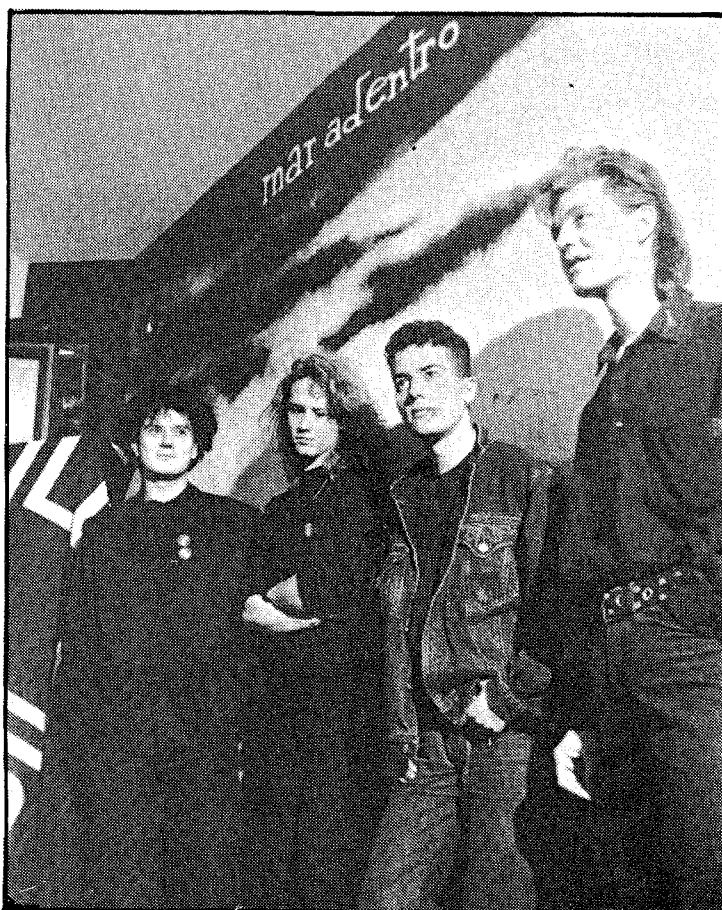
El grupo zaragozano Héroes del Silencio presentó en sociedad su primer LP, el lunes pasado, en una fiesta a la que acudió mucha gente relacionada con el pop local