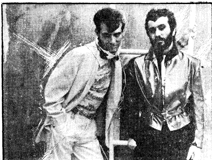
Azul y Negro