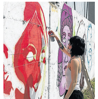
Ayer se pintó en Torrero un grafiti alusivo al 8-M. J. M. MARCO