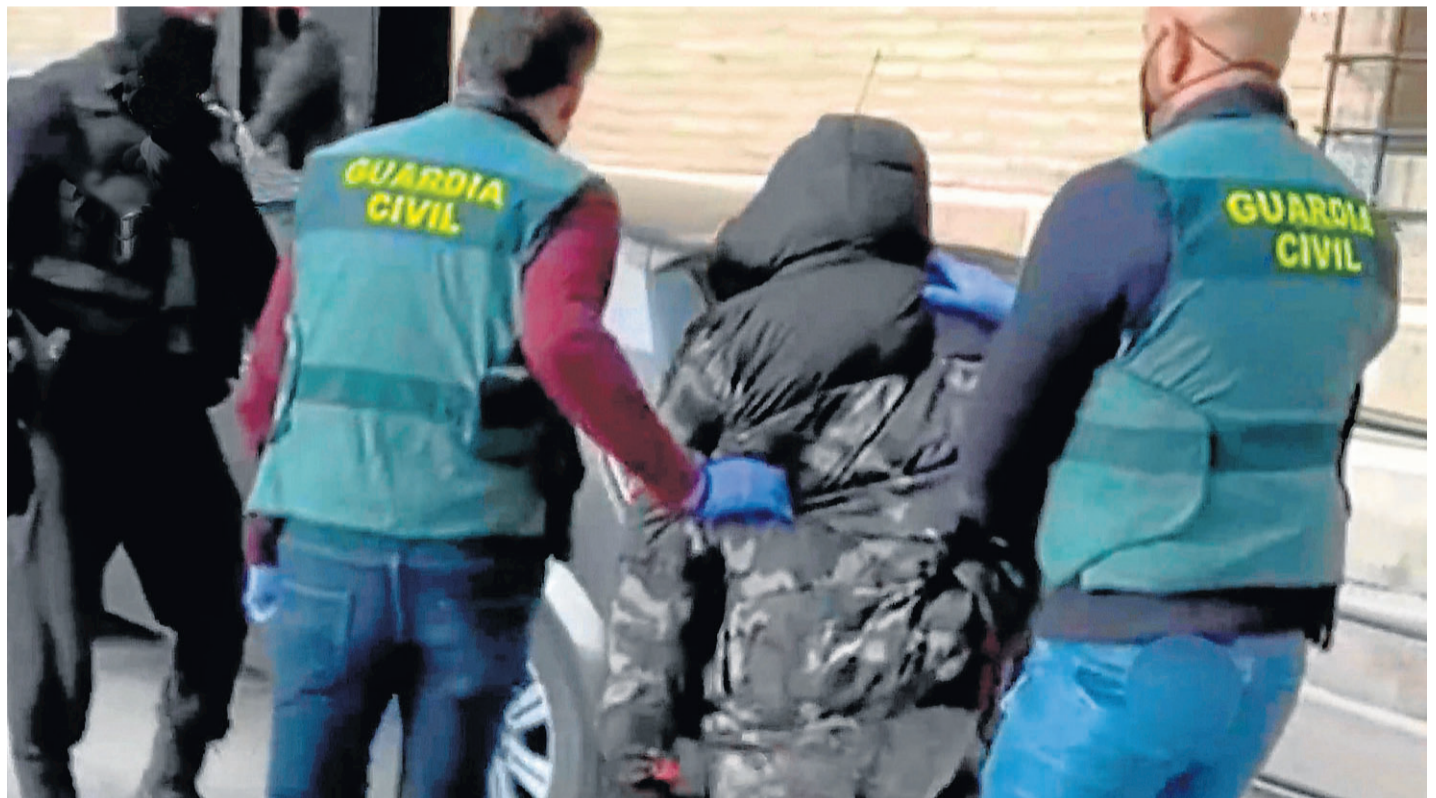
Imagen de vídeo de varios agentes trasladando en Borja al detenido, que era buscado desde hace años.

Un gran despliegue de la Guardia Civil detuvo ayer a un peligroso fugitivo en Borja. El delincuente, de 29 años y natural de Ejea de los Caballeros, estuvo a punto de ser detenido en la localidad turolense de Andorra el pasado diciembre, pero entonces logró escabullirse. Sobre él pesan 17 órdenes de detención por, entre otros delitos, tentativa de homicidio, robo y estafa. PÁG. 18