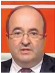
Miquel Iceta.