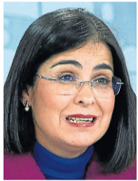
Carolina Darias.