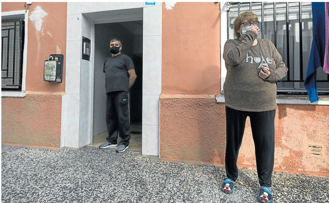
JOSÉ MIGUEL MARCO

El jefe de Estado Mayor de la Defensa (Jemad), el general Miguel Ángel Villarroya, solicitó ayer su cese a la ministra de Defensa, Margarita Robles, tras su vacunación. Villarroya sostiene que siguió los protocolos y que no se aprovechó de «privilegios no justificables». Robles aceptó la renuncia. PÁG. 26