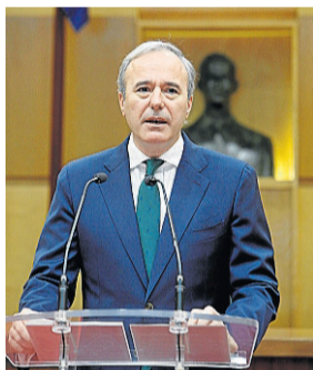
El alcalde, ayer. J. BELVER

● Avanza un montante de 16 millones en ayudas sociales urgentes para 2021, aunque no fija una estrategia postcovid