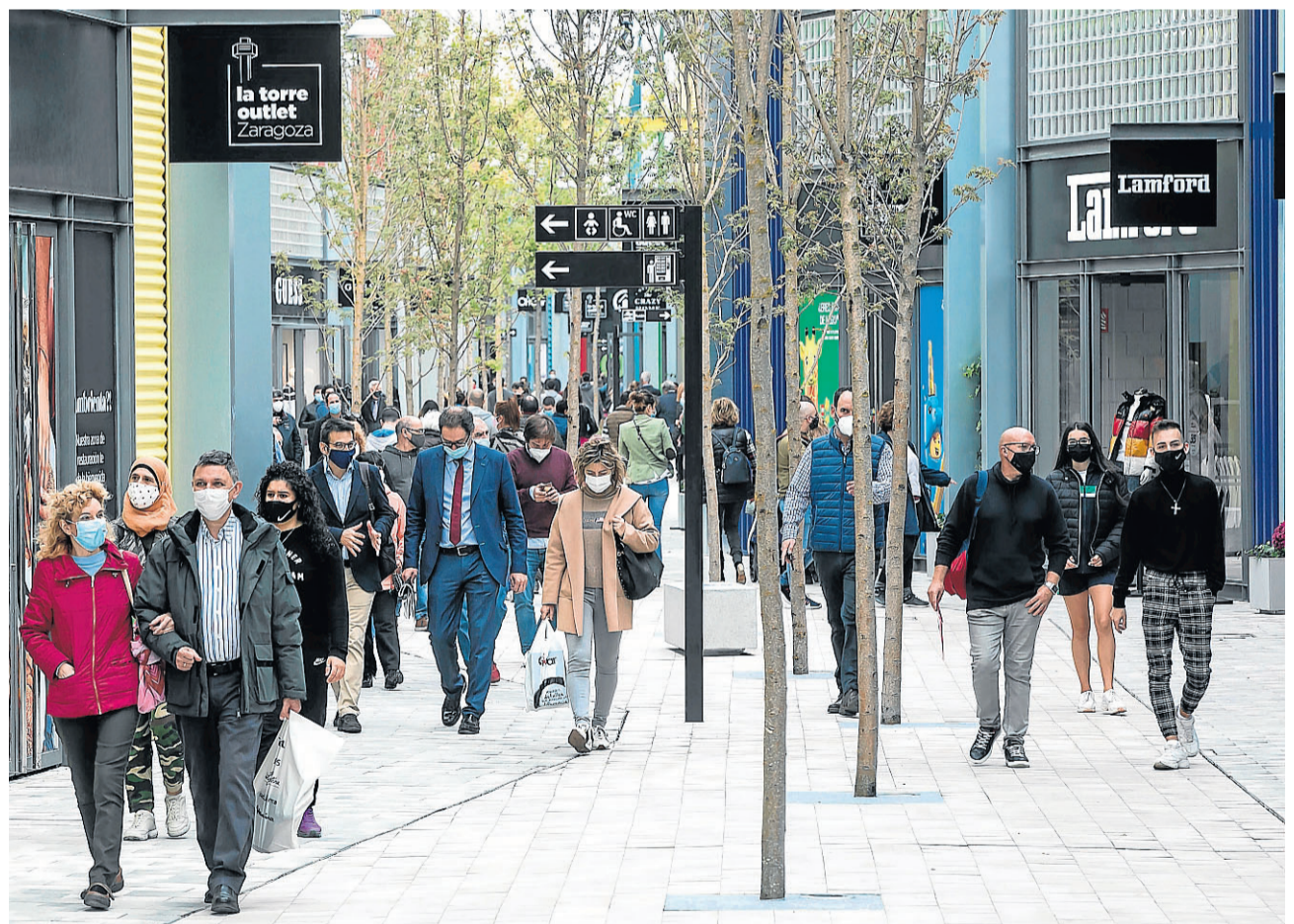
El nuevo centro comercial tuvo una buena acogida de público, pero no se produjeron agobios.

Sánchez respondió al rechazo de Casado a apoyar la moción de censura con el anuncio de la paralización de la reforma del CGPJ –que ha sido recibida con recelo en la UE y por los jueces– y un ofrecimiento al PP para negociar. PÁGS. 26-27